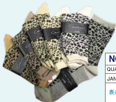
アソート 10 足組