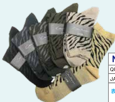
アソート 10 足組