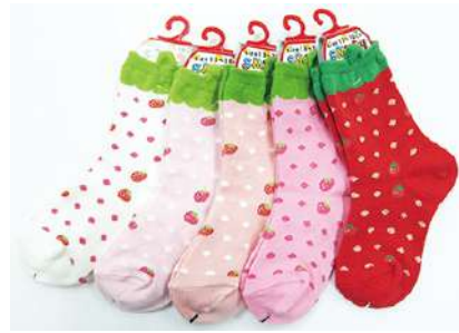
No.N-278 入荷済み いちごヘタピコ C,A,Pe,N,Pu JAN : 4993645392783