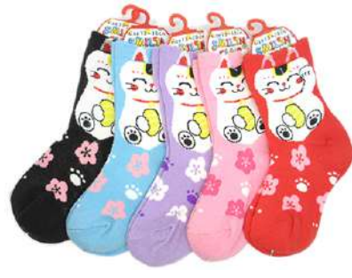
No.N-505 10月末~ 招き猫ピコ C,A,Pe,N,Pu JAN : 4993645479057