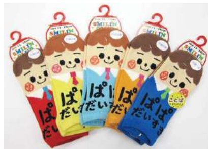
No.N-122 入荷済み ぱぱだいすき C,A,Pe,N,Pu JAN : 4993645220031