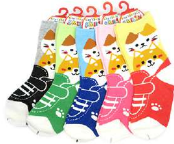
No.N-507 9月末~ 猫と柴犬スニーカー C,A,Pe,N,Pu JAN : 4993645479071