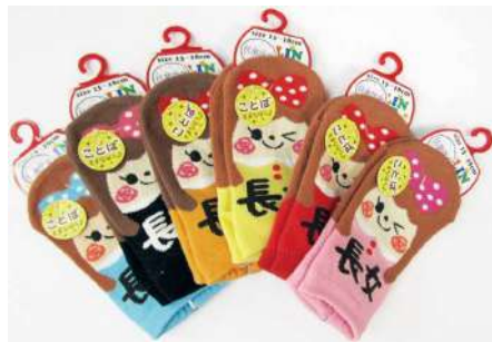
No.N-143 入荷済み 長女 すべり止め付き 完売 C,A,Pe,N,Pu JAN : 4993645220246