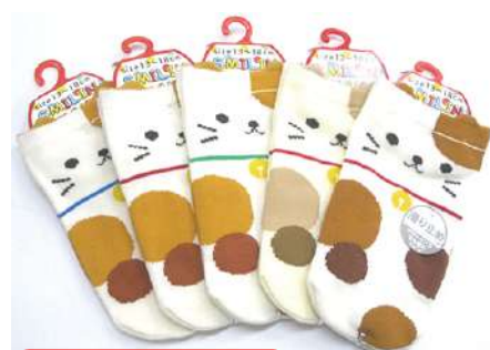
No.N-408 入荷済み ミケネコ すべり止め付き 完売 C,A,Pe,N,Pu JAN : 4993645478081