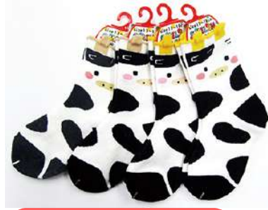
No.N-218 入荷済み うしピコ C,A,Pe,N,Pu JAN : 4993645392189