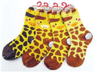
No.N-216 入荷済み きりんピコ C,A,Pe,N,Pu JAN : 4993645392165