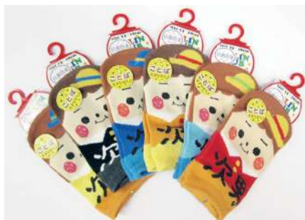
No.N-149 入荷済み 次男 すべり止め付き 完売 C,A,Pe,N,Pu JAN : 4993645220307