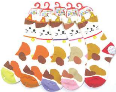
No.N-503 入荷済み みけねこ C,A,Pe,N,Pu JAN : 4993645479033