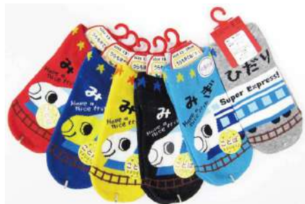
No.N-111 入荷済み 新幹線 欠品中 みぎひだり C,A,Pe,N,Pu JAN : 4993645219929