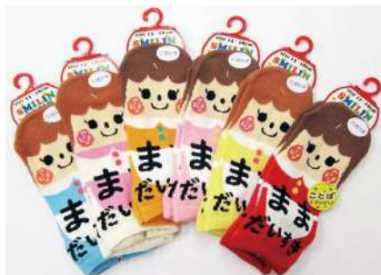
No.N-123 入荷済み ままだいすき C,A,Pe,N,Pu JAN : 4993645220048