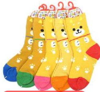
No.N-504 10月末~ 柴犬ピコ C,A,Pe,N,Pu JAN : 4993645479040