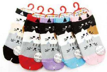
No.N-110 入荷済み だんだんネコ すべり止め付き C,A,Pe,N,Pu JAN : 4993645391106