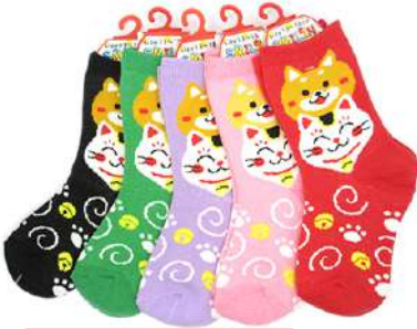
No.N-506 9月末~ 柴犬と招き猫 C,A,Pe,N,Pu JAN : 4993645479064