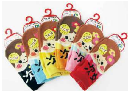
No.N-144 入荷済み 次女 すべり止め付き 完売 C,A,Pe,N,Pu JAN : 4993645220253