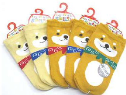
No.N-407 入荷済み 柴犬 すべり止め付き C,A,Pe,N,Pu JAN : 4993645478074