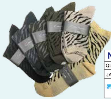
アソート 10 足組