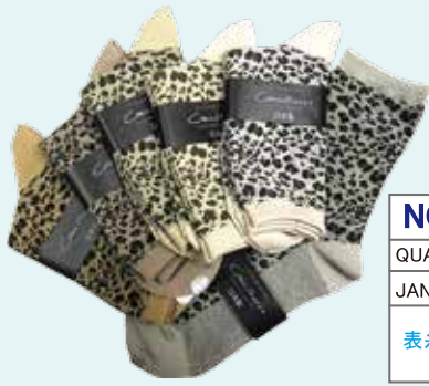
アソート 10 足組